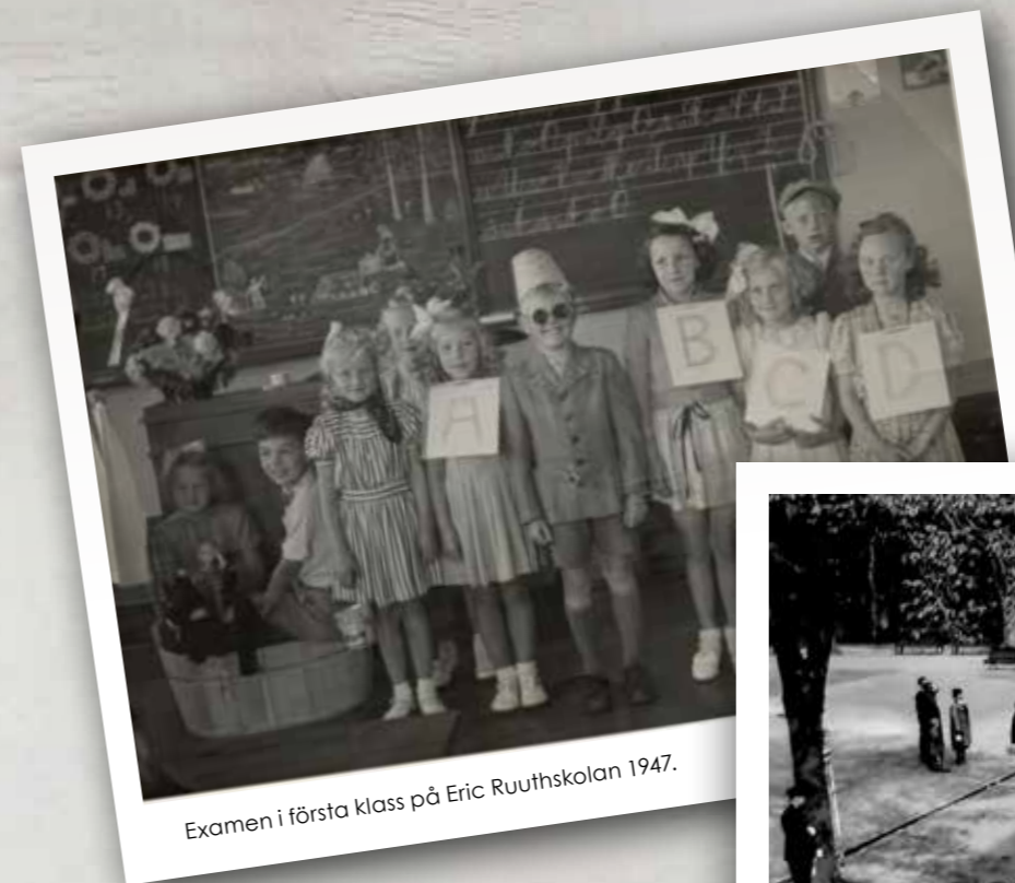
Examen i första klass på Eric Ruuthskolan 1947.

Ett hus är egentligen bara väggar och tak, men jag vill ändå se Eric Ruuth lite som Höganäs eget Hogwarts - en plats för magi! Och förhoppningsvis sitter det kvar "i väggarna" i minst 100 år till.