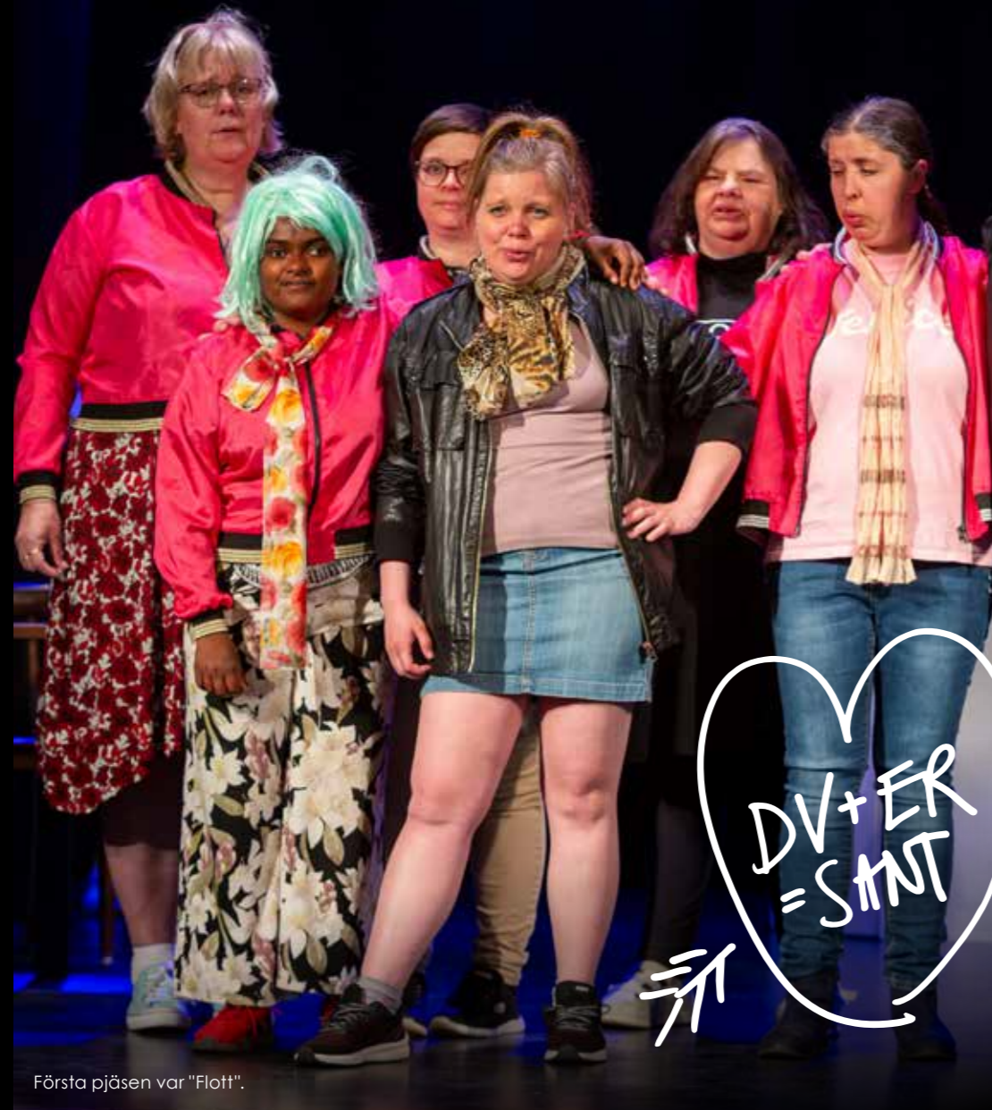
Första pjäsen var "Flott".