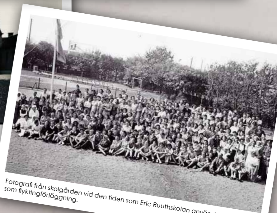
Fotografi från skolgården vid den tiden som Eric Ruuthskolan användes som flyktingförläggning.