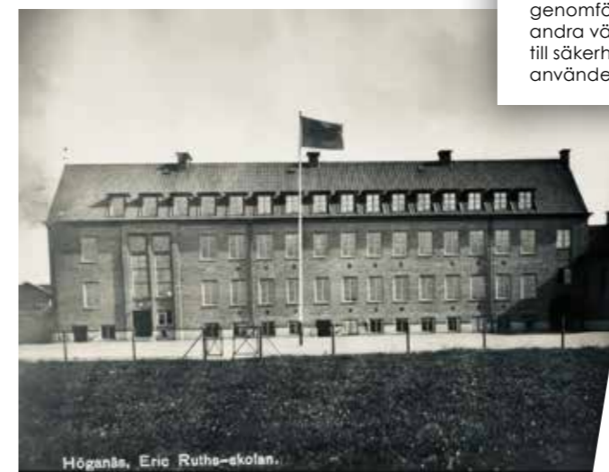
Höganäs, Eric Ruuth-skolan. Äldre foto på skolan, innan flygeln byggdes till.