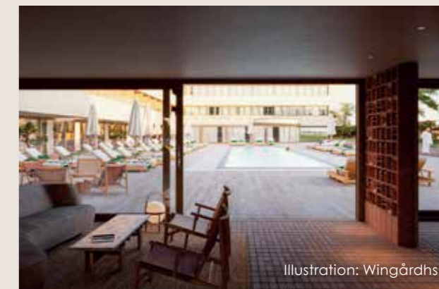
Preliminär visionskiss av atriumet med poolen i centrum.