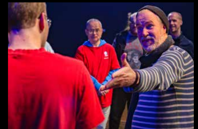
Pågående repetition på Eric Ruuth kulturhus.