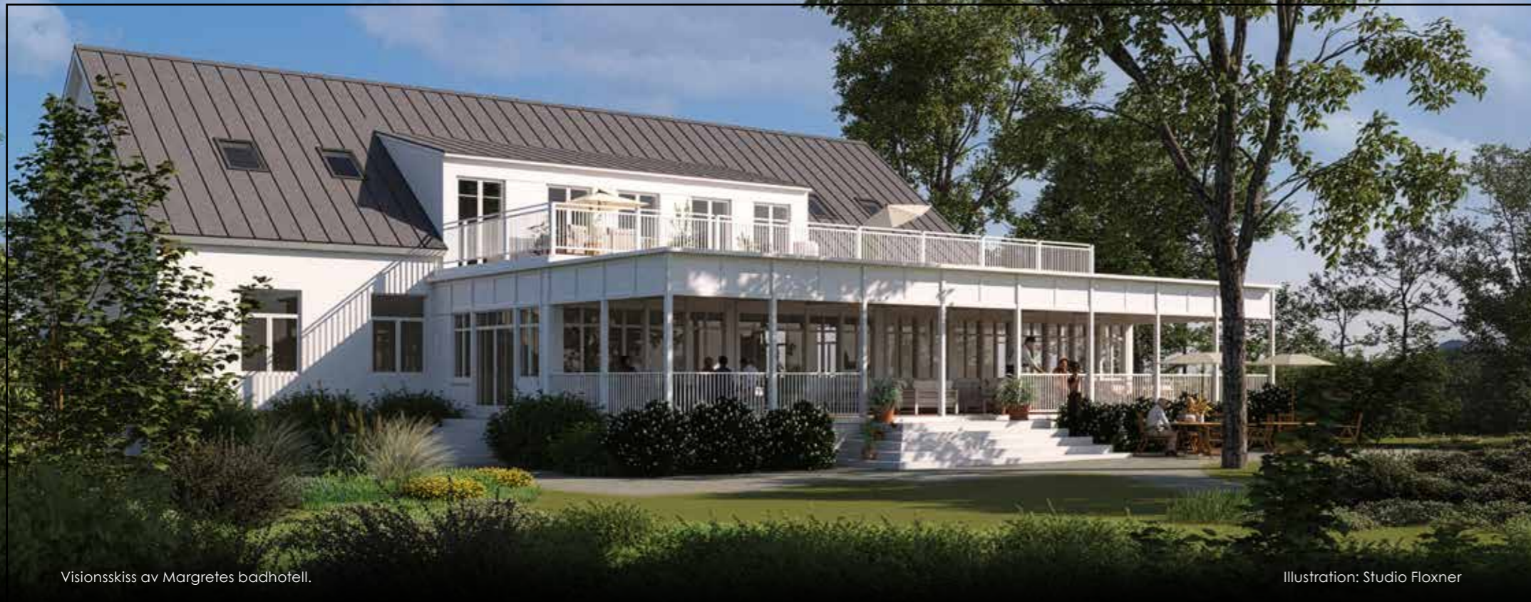
Visionsskiss av Margretes badhotell.