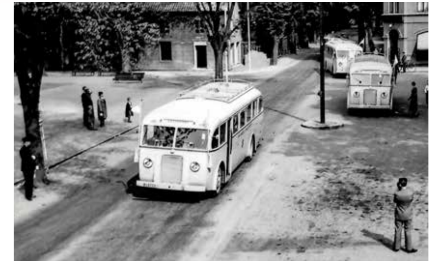
Vita bussarna anländer till Höganäs. Vita bussarna var en räddningsinsats som genomfördes av svenska och danska Röda Korset våren 1945, i slutskedet av andra världskriget. De hämtade fångar från koncentrationsläger och förde dem till säkerhet i Sverige. Höganäs var en av mottagningsorterna och Eric Ruuthskolan användes som flyktingförläggning.