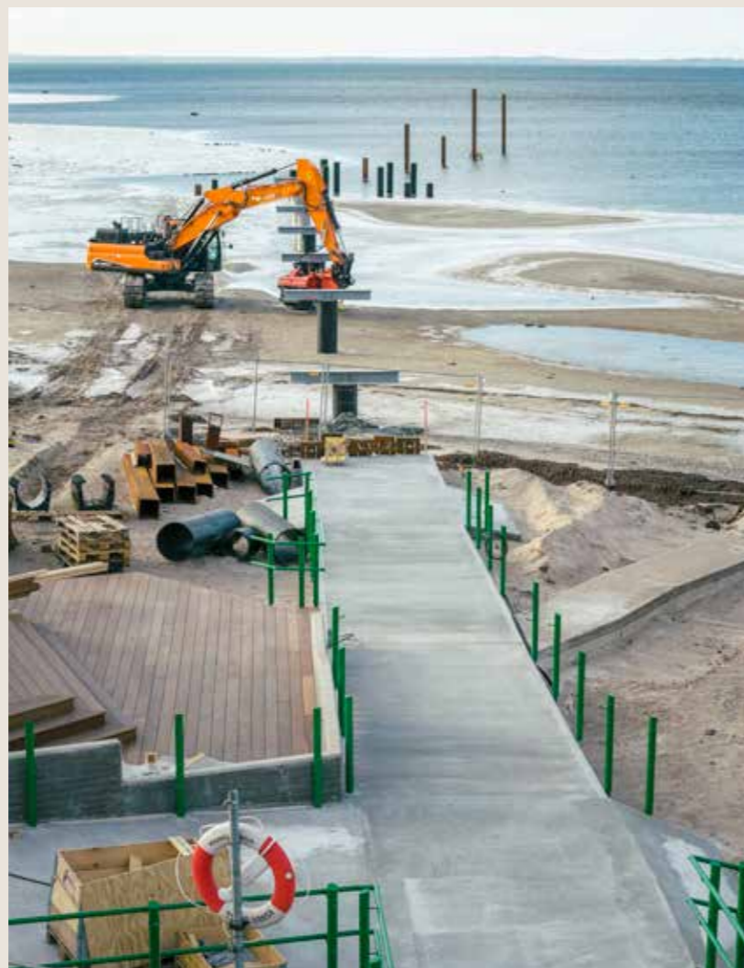
Sommaren 2026 kan du ta ditt första dopp här.