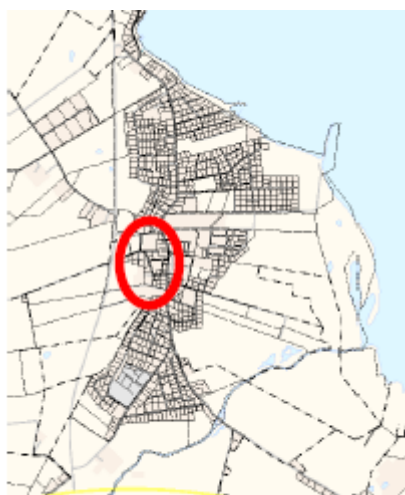
Bild: planområdet, placering i orten

Syftet med detaljplanen är att möjliggöra bostäder och service/centrumverksamhet samt att skydda den nuvarande bygganden inom fastigheten som tidigare varit ett bibliotek.