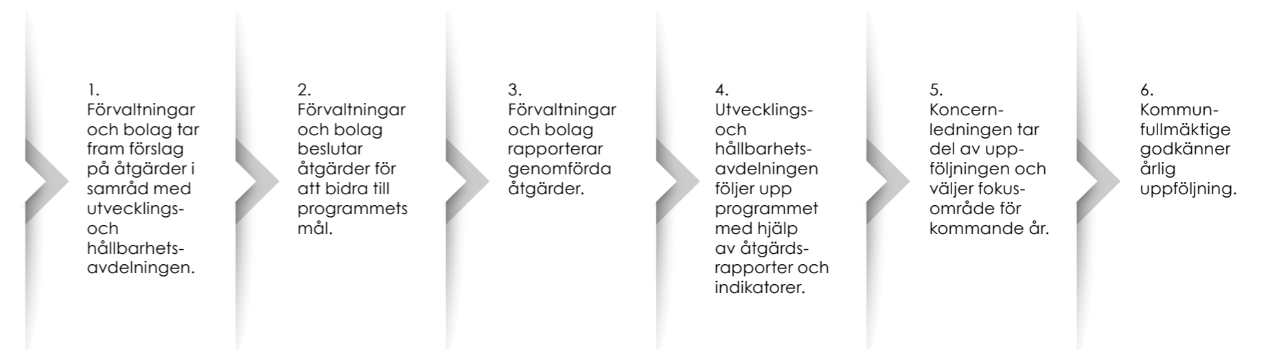
Figuren visar processen för hållbarhetsprogrammet

Utvecklings- och hållbarhetsavdelningen har en samordnande roll i genomförande och uppföljning av programmet. Resultaten redovisas årligen till kommunfullmäktige, som har det övergripande ansvaret för uppföljningen. Uppföljningen bygger på rapporter om genomförda åtgärder och indikatorer*. Hållbarhetsprogrammet ska revideras efter halva programperioden.