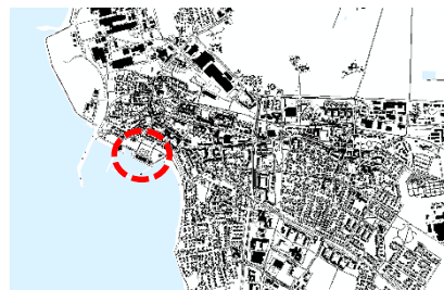
Planområdets placering i orten.

Förslaget överensstämmer med kommunens översiktsplan.